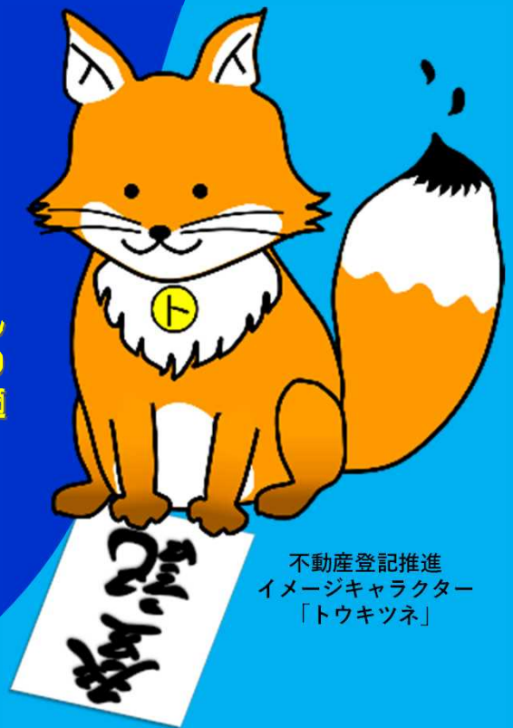
不動産登記推進 イメージキャラクター 「トウキツネ」