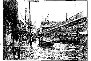
平成25年8月大阪市梅田駅周辺での浸水