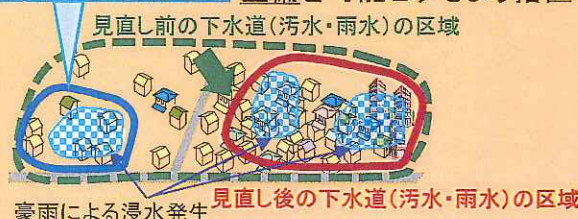
豪雨による浸水発生