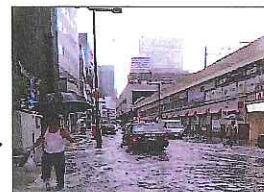
平成25年8月大阪市梅田駅周辺の浸水