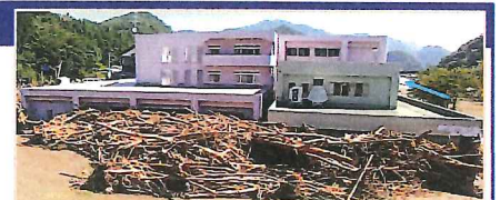
平成28年台風10号により、岩手県の要配慮者利用施設では利用者9名の全員が死亡。