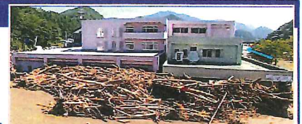
平成28年台風10号により、岩手県の要配慮者利用施設では利用者9名の全員が死亡。