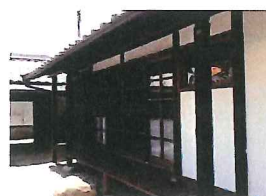
古民家を宿泊施設に改装して運営(明日香村おもてなしファンド)