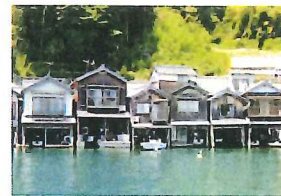
舟屋をカフェ・宿に改装して運営(伊根 油屋の舟屋「雅」)