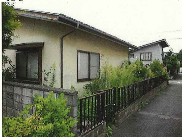
【敷地全景 北東より撮影】R5.9.21撮影