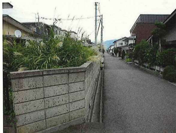
【南側道路との境界の状態】R5.9.21撮影 ・枝葉の越境はほとんどない。