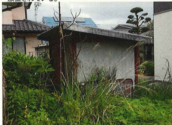
【附属屋の状態】R6.5.21撮影 母屋の東に附属屋あり