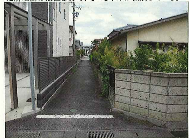
【東側道路との境界の状態】R5.9.21撮影 ・枝葉の越境はほとんどない。