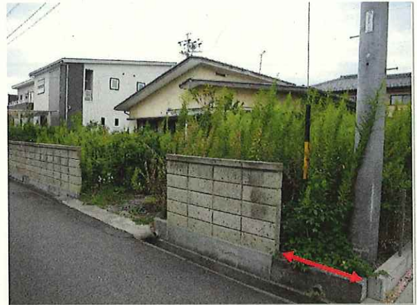
【敷地全景 南東より撮影】R5.9.21撮影 ・赤の矢印部分は、東側隣地を売買するときに残された隣地側の残置部分で、そこも草木が繁茂している。