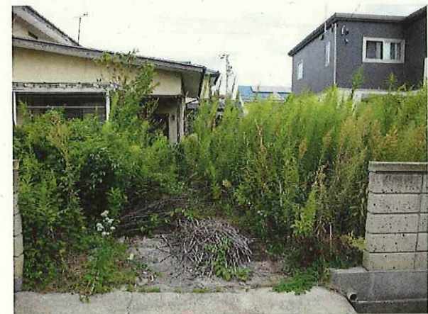
【玄関前の状態】R5.9.21撮影 ・雑草は繁茂しており、刈られた草木が敷地内に放置されている。