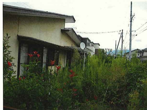
【南側庭の状態】R5.9.21撮影 ・庭前面で草木が繁茂している。