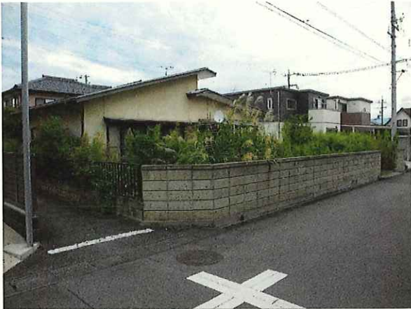
【敷地全景 南西より撮影】R5.9.21撮影 ・草木は繁茂しているが高木がないため建物は確認できる