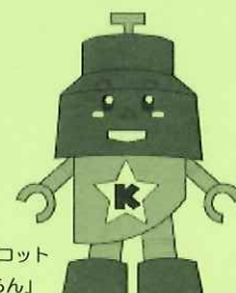
川口市マスコット 「きゅほらん」