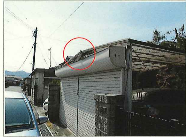
【カーポート部分】 ・シャッター上の幕板が剥がれている。