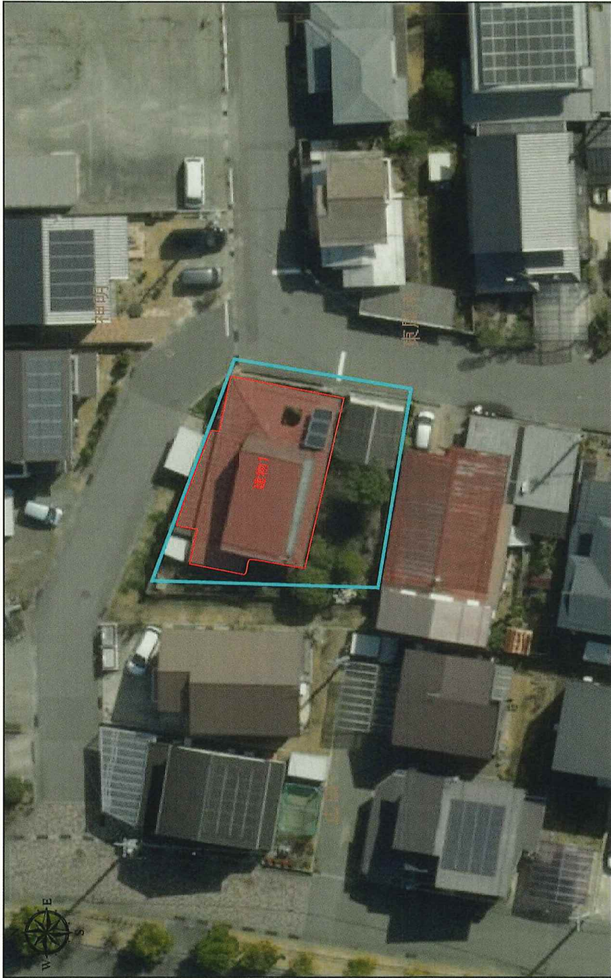
空家等配置図 (航空写真)