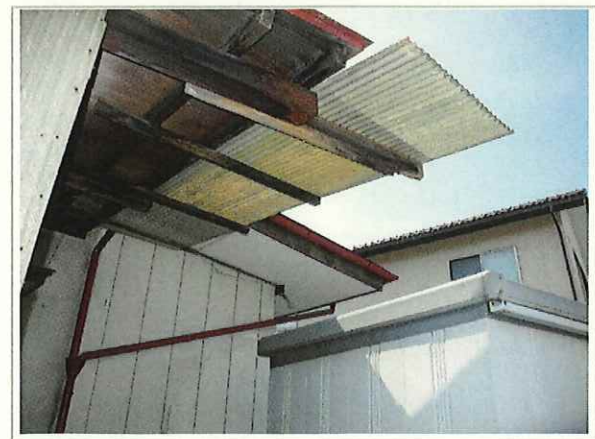
【建物(北)】 ・タキロンを使って庇を設置している。 タキロンは劣化している。