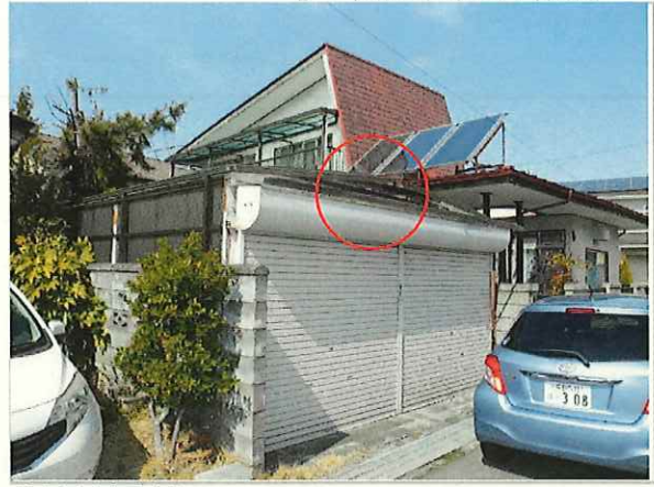
【全景(南東)】 ・シャッター上の幕板が剥がれている。 ・タキロンは破損していないように見える