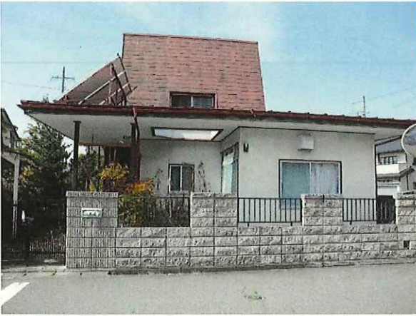
【全景(東)】 ・建物は目立った破損等無