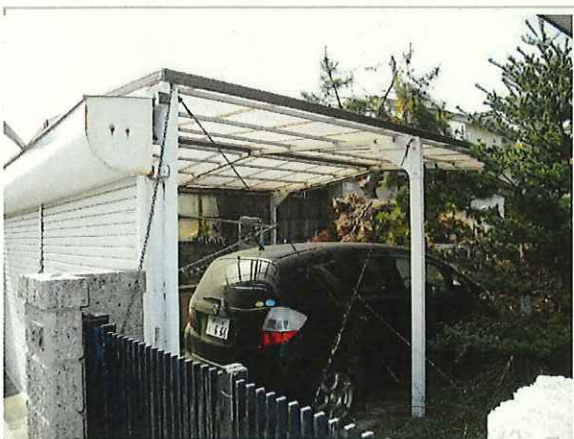
【敷地内(南)】 ・高木の繁茂 ・ナンバー付きの残置車両あり。