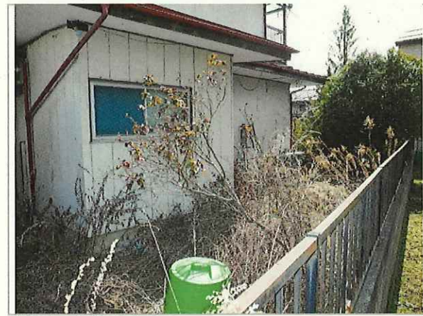
【敷地の状態(西)】 ・管理されていない